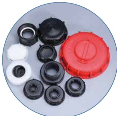
TAPA INFERIOR DE IBC DE 2 PULGADAS