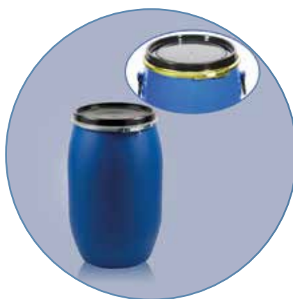
SUNCHO DE METAL