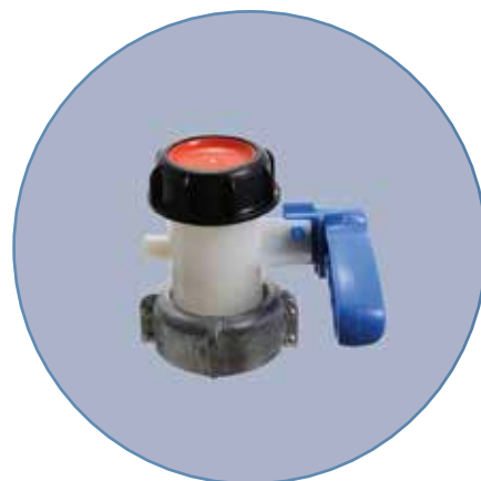
VÁLVULA DE IBC