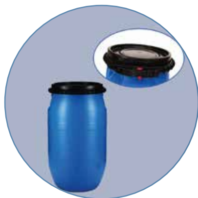
SUNCHOS DE PLÁSTICOS