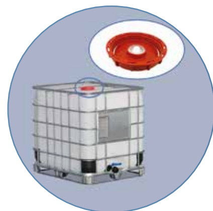
TAPA SUPERIOR DE 4 PULGADAS