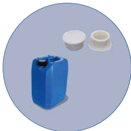
TAPAS DE BIDONES